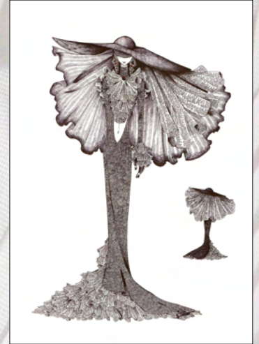
竹内 瑠珈 (伊勢学園高等学校)