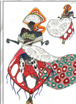
榛葉 天音 (常葉大学附属菊川高等学校)